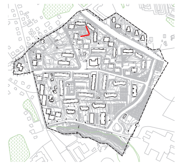
Ramybės kvartalas. T1 teritorija.