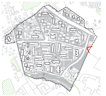
Ramybės kvartalas. T8 teritorija.