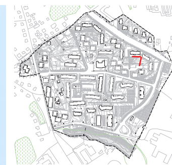
Ramybės kvartalas. T2 teritorija.