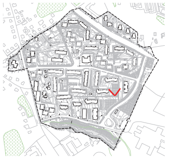
Ramybės kvartalas. T5 teritorija.